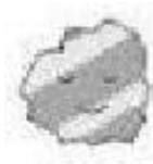
สารส้มชนิดก้อน